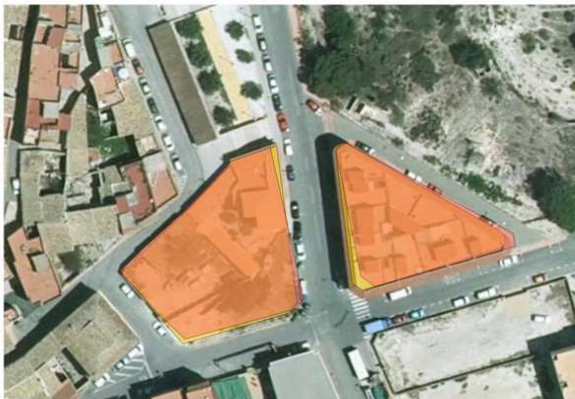
Superposición de la planimetría del planeamiento vigente y la modificada.