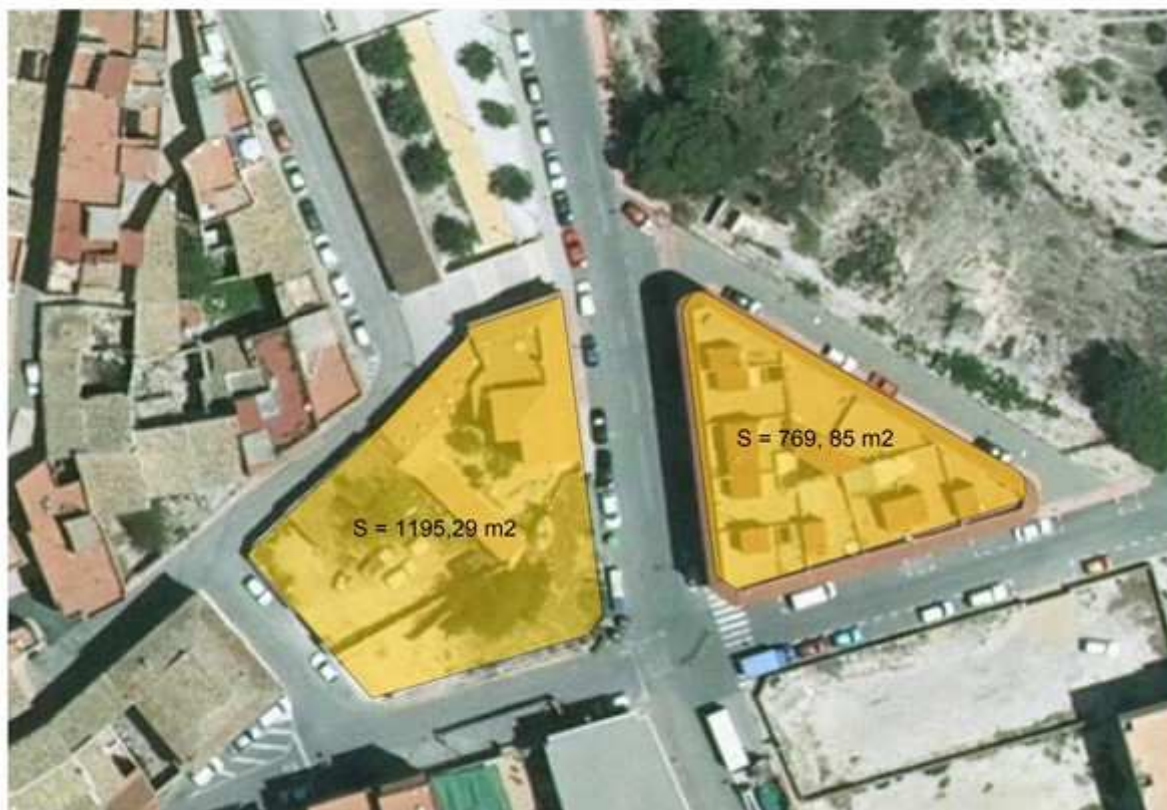
Manzanas según la modificación de alineaciones.